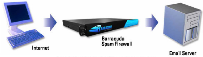
Standard Deployment Configuration